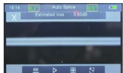
Immagine chiara della fibra e della giunzione