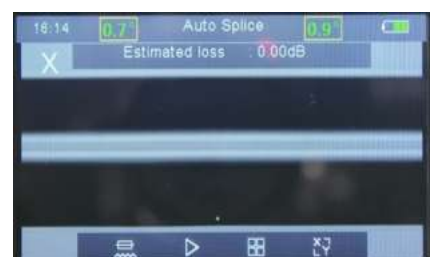
Immagine chiara della fibra e della giunzione