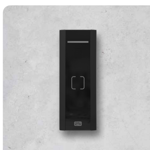
2N® ACCESS UNIT M RFID MULTIFREQUENCY, NFC 916114