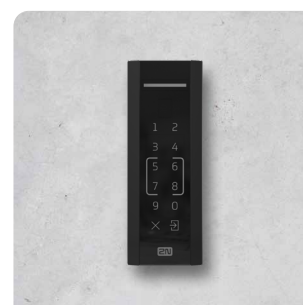
2N® ACCESS UNIT M TOUCH KEYPAD & RFID, NFC 916116